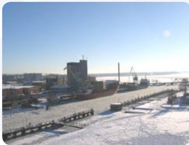
Centralt läge alldeles intill vattnet. Kanske passar det bättre med bostäder än med hamn i Vänersborg.

En knäckfråga är naturligtvis finansieringen. En ny terminal